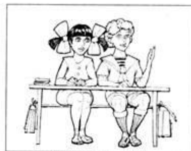
ВЫПОЛНЯТЬ ЗАДАНИЯ УЧИТЕЛЯ