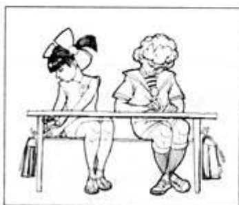
ИГРАТЬ НА УРОКЕ