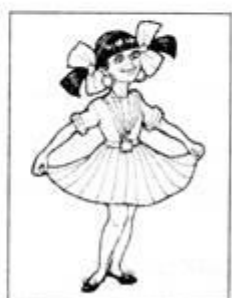
ПОХВАСТАТЬСЯ НОВОЙ ОДЕЖДОЙ