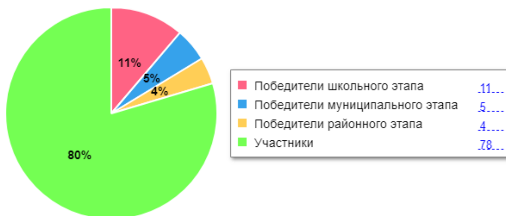
Диаграмма по результатам участия школьников во ВсОШ